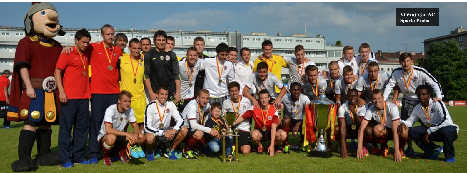
Vítězný tým AC Sparta Praha

Uspořádat akci, jejíž část se dostala i do televize, nemusí být pro muže, kteří teprve od sezony 2013/14 nakoukli do profesionálního fotbalu, ▶