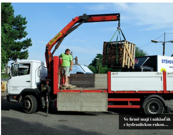
Ve firmě mají i nákladák s hydraulickou rukou...