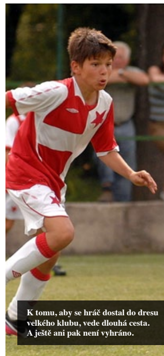
K tomu, aby se hráč dostal do dresu velkého klubu, vede dlouhá cesta. A ještě ani pak není vyhráno.

Učelnivost pomáhá samozřejmě i to, pokud děti-hráči rozumějí tomu, proč se jaké činnosti ve hrách či cvičeních dělají. Jde tedy o herní souvislosti. Pokud rozumějí proč, snadněji vzniká vnitřní motivace a snadněji se navazuje na to, jakým způsobem se věc naučit. ■