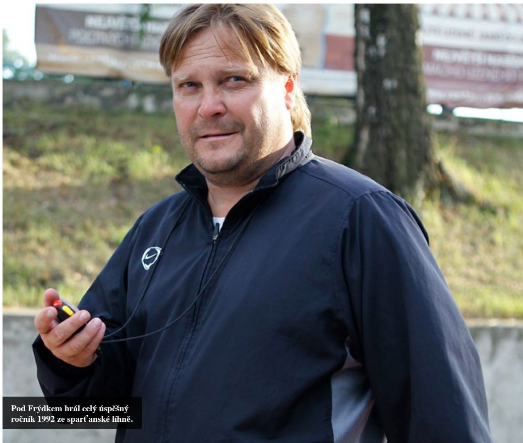
Pod Frýdkem hrál celý úspěšný ročník 1992 ze spartánské láně.

bránit a vy se do něj budete chtít dostat, můžete dostat blbý gól a záměr vám nevyjde. Ve Vlašimi jsme měli lepší útočnou fázi než tu obrannou, dávali jsme hodně gólů, ale dost jsme jich dostávali. Na tom musíme v Motorletu zapracovat. Platí ale, že když útočíte, musí soupeř bránit a nemá tolik času a prostoru, aby útočil on.