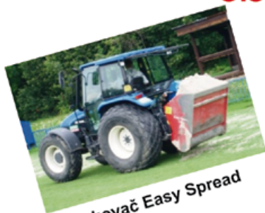
Pískovač Easy Spread

Odborná údržba umělých trávníků. Čištění, dekomprese a doplňování granulátu. Sportovní stavby na klíč.