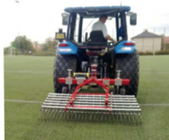
Verti - Rake