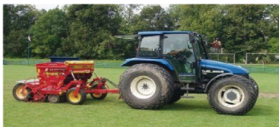
Rapid Turf 200

Zajišťujeme pokládku travních koberců a realizaci kompletních zavlažovacích systémů.