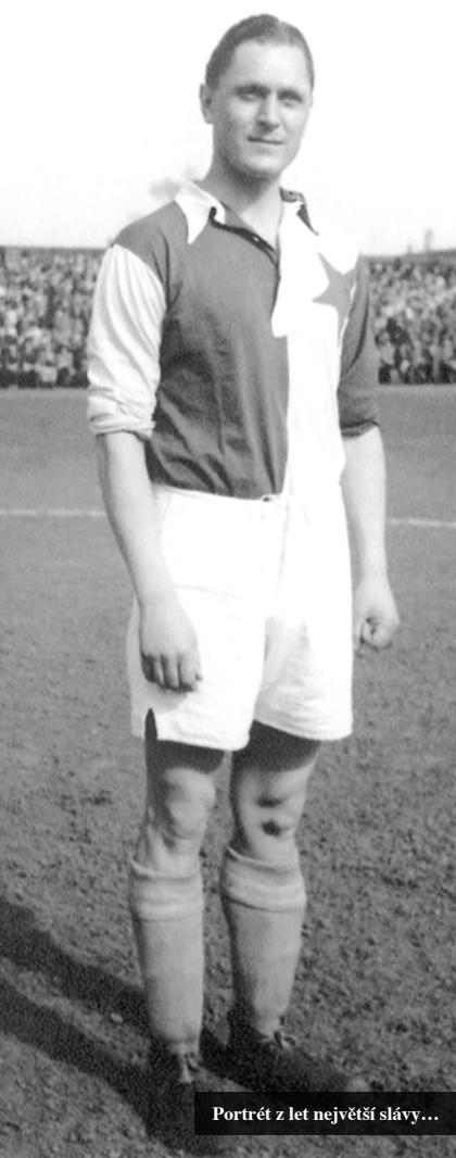
Portrét z let největší slávy...