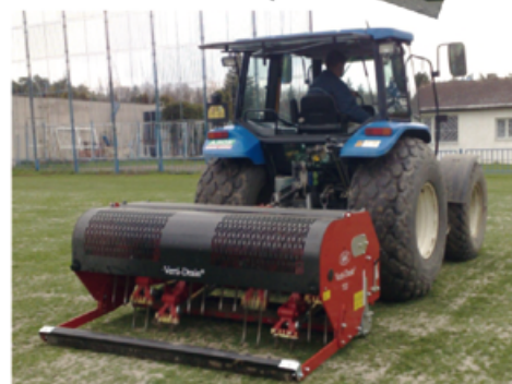
Verti - Drain

Finančně výhodná varianta rekonstrukce!!!! Rekonstrukce fotbalových trávníků lze provést využitím materiálu ze stávajícího povrchu plochy hřiště.