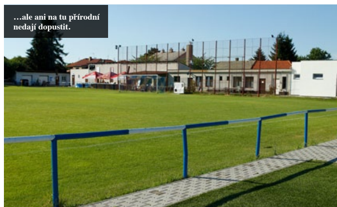
...ale ani na tu přírodní nedají dopustit.