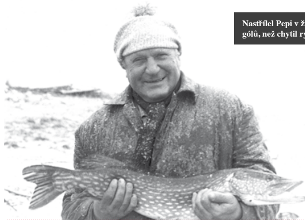
Nastřílel Pepi v životě víc gólů, než chytil ryb?

Slávisté se tedy vydali k Dunaji políčit na jiného ostrostřelce, Franze „Bimbo“ Bindera z Rapidu. Neuspěli, ale přivezli senzační zvěst: