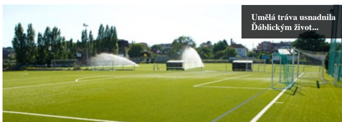
Umělá tráva usnadnila Ďáblickým život...